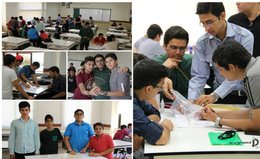
آموزش‌های گروهی دانش‌آموزان مدرسه کسب و کار