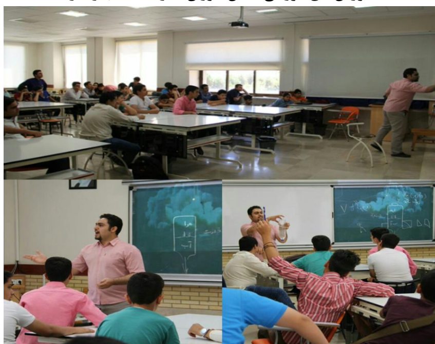
کلاس‌های آموزشی مدرسه کسب و کار

تجربه موفق سال‌های گذشته و رضایت والدین از عملکرد مجموعه سبب گردید تا عوامل مجموعه تصمیم به گسترش و تجهیز کامل مدرسه کسب و کار بگیرند. برای این منظور سرمایه ابتدایی را با همکاری شتابدهنده ، مرکز رشد و برای ایجاد محیط مناسبی جهت مدرسه کسب و کار فراهم آوردیم. اما هدف ما اینست که مهارت اجرایی دانش‌آموزان را بالا ببریم و به آنها فرصت دهیم تا ایده‌های فکری خود را با مهارت‌های اجرایی خود و منتورهایشان به واقعیت تبدیل کنند. این شیوه‌ای است که در مدارس جهان اجرا می‌گردد و ما سعی بر این داریم تا به استانداردهای جهانی نزدیک شویم.